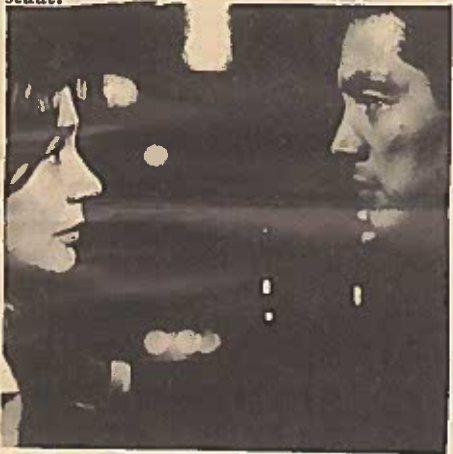
Hiroshima mon amour

Hiroshima is een typisch product van zijn tijd. De koude oorlog woedde in alle hevigheid, de mensheid vreesde een atoombomoorlog, de wereld leefde in angst en onzekerheid. Dit heeft zijn weerslag gevonden op de film om niet te zeggen, dat dit in de film centraal staat.