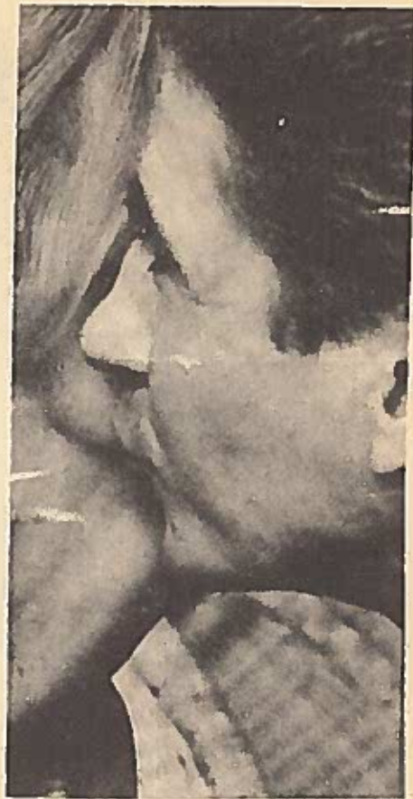
Alain Resnais met Ingrid Thulin op het Festival van Cannes

In tegenstelling tot bv. Godard heeft Resnais goed begrepen dat film een massacommunicatiemiddel is en blijft. Met alle respect voor Jean-Luc Godard geloof ik toch, dat Godard met zijn "poëtische camera" in zijn laatste films te ver gaat. Godard verliest de communicatie met de kijkers en dat is een grote tekortkoming. Dit wil niet zeggen, dat ik voor gezapige, zoete films met happy-end pleit, integendeel. Ook Resnais heeft geëxperimenteerd (bv. in "Mariënbad"), doch heeft de communicatie met het publiek niet verloren. Daarbij heeft Resnais ook actualiteit in zijn films verwerkt. In de film "Muriël" speelt de Algerijnse oorlog een grote rol. Met alle waardering voor de moderne cineasten ben ik toch bang dat zij één ontzettend belangrijk punt uit het oog verliezen: dat film een communicatiemiddel is.