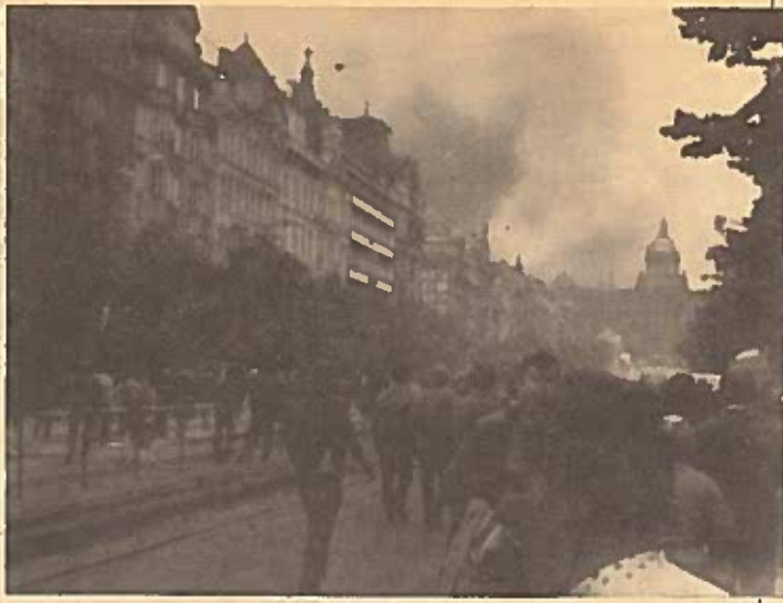
Vanaf het Wenceslas plein haasten mensen zich naar het centrum van geweld: rookwolken boven Radio Praag.