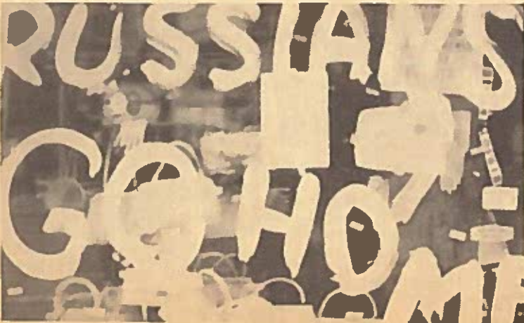
Voor onderschrift zie foto.