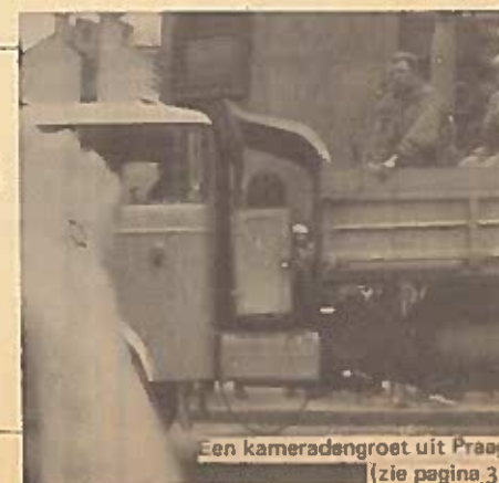
Een kameradengroet uit Praag— (zie pagina 3)