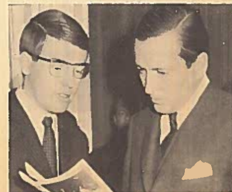
Claus en KRANT